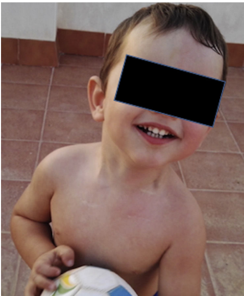
Figuras 2 y 3 Enrojecimiento facial unilateral y de hemitórax superior izquierdo tras la realización de ejercicio.