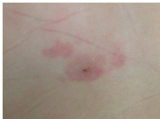
Figura 1 Imagen fotográfica de la región lumbosacra del paciente.

El SDE es un tipo de disrafia espinal oculta, con una incidencia estimada de 1/2.500 nacidos vivos. Se trata de un tracto tubular revestido por células epiteliales, generalmente localizado a nivel lumbar o lumbosacro. En el 60% de los casos termina a nivel intradural 1 . Los estigmas cutáneos más frecuentemente asociados a ellos son hoyuelos dérmicos, hipertriosis, alteraciones de la pigmentación y lipomas 2 . En el caso de que el hoyuelo dérmico esté situado por encima del pliegue glúteo o acompañado de un segundo estigma cutáneo, se recomienda realización de