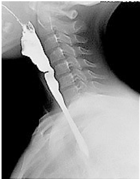
Figura 1 Tránsito digestivo superior (lateral): se observa estrechamiento en el tercio.

La disfagia es la dificultad para tragar alimentos. Dentro de sus causas se encuentran las estenosis congénitas, la esofagitis eosinofílica, la acalasia, la estenosis péptica y el síndrome de Plummer-Vinson.