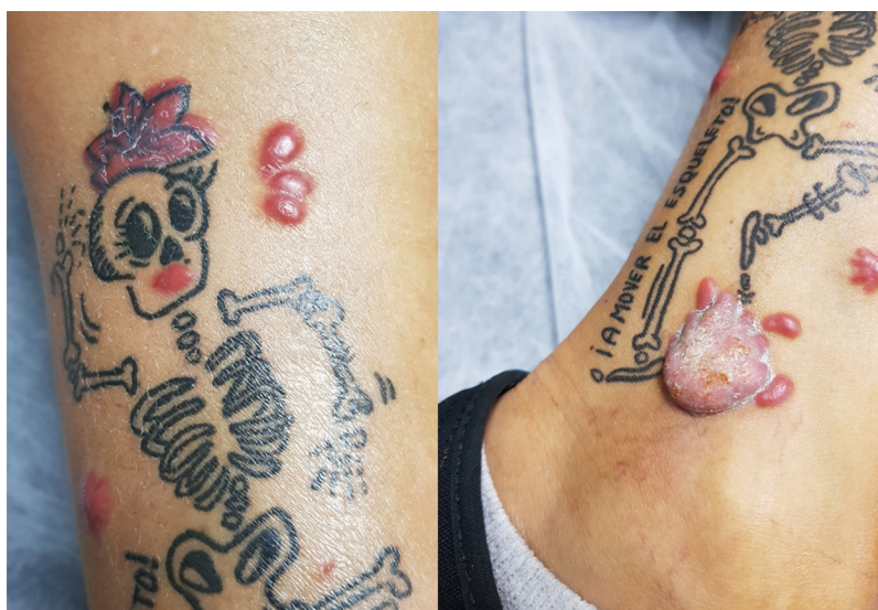
Figura 1 A) Pápulas inflamatorias confinadas a la tinta roja del tatuaje. B) Lesión hiperqueratósica en tobillo.

mostró un tumor dermoepidérmico hipoecogénico mal delimitado sin artefactos con abundante vascularización intralesional en el modo Doppler (fig. 2A). Las pruebas complementarias solicitadas incluyendo hemograma, bioquímica, hormonas tiroideas, enzima convertidora de