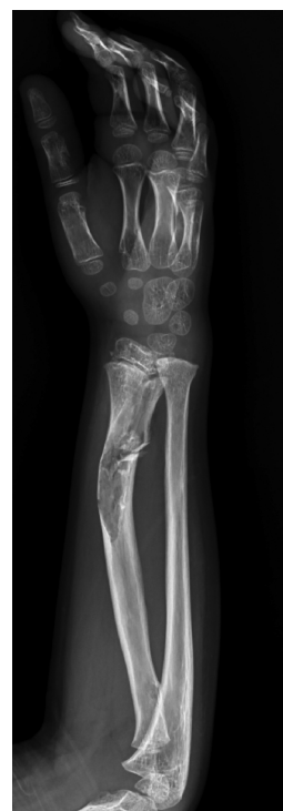
Figura 1 Fractura patológica en el radio con imágenes radiolucidas y deformidad angular asociada.

El diagnóstico diferencial debe incluir la displasia fibrosa, los infartos óseos y el condrosarcoma de bajo grado.