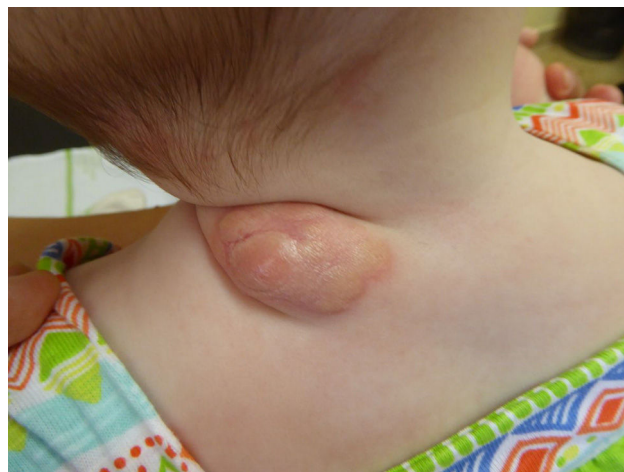
Figura 2 Masa en región cervical posterior de 35 × 25 mm, compuesta de pequeños nódulos de coloración amarillenta y tacto gomoso.