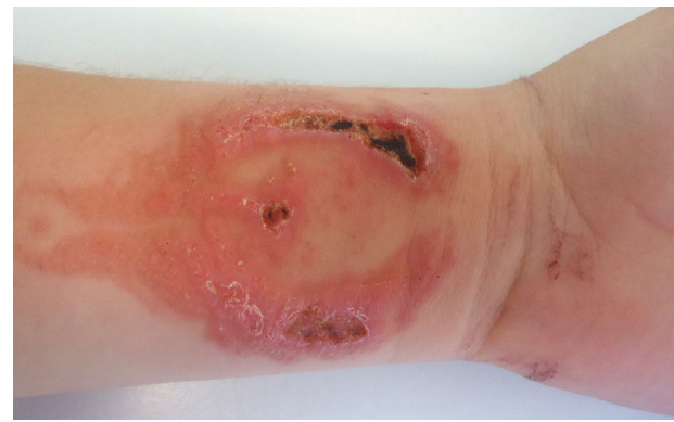
Figura 4 Dermatitis de contacto por PPDA con lesiones necróticas tras tatuaje de un fénix con henna negra adulterada con PPDA. Las lesiones dejarán cicatrices permanentes.

Las concentraciones de PPDA encontradas en la henna negra en la literatura oscilan entre el 0,4 y el 29,5% 4,5 , siendo en la mayoría de las ocasiones muy superior al presente en tintes capilares. Esto convierte a la henna negra en una sustancia con muy alta capacidad sensibilizante.