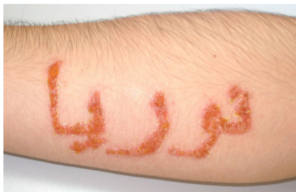
Figura 1 Dermatitis alérgica de contacto por PPDA tras tatuaje de henna negra en adolescente de 16 años. Se aprecian eritema y vesiculación con formación de costras demarcando la zona de realización del tatuaje.

El objetivo del presente estudio fue determinar la prevalencia de sensibilización a PPDA en la población pediátrica