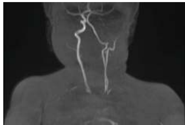
Figura 2 Imagen de la angioresonancia cervical en la que se observa la hipoplasia/aplasia de arteria carótida interna izquierda, con una compensación de la vertebral izquierda.