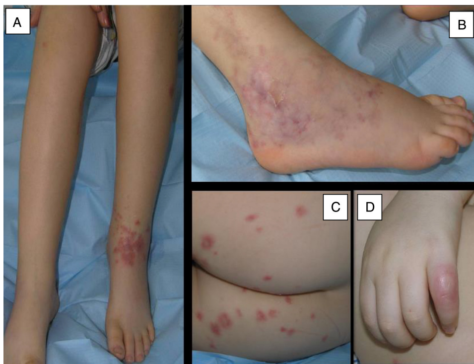
Figura 1 Lesiones cutáneas del caso 1. A) Tumefacción dolorosa de tobillo izquierdo con lesiones purpúricas en cara anterior. B) Livedo reticularis con sufusión hemorrágica en cara externa del tobillo derecho. C) Lesiones purpúricas aisladas en glúteos. D) Nódulo cutáneo en el 5.º dedo de la mano derecha

Niña de 6 años con cuadro de 15 días de artralgiás, artritis de tobillos y lesiones purpúricas (fig. 1A-C). Presentaba anemia y trombocitosis (Hb: 11 g/l; plaquetas: 495.000/mmc), PCR: 236 mg/l, VSG: 88 mm y ANCA negativos. La biopsia cutánea fue compatible con PAN. Presentó mala evolución, asociando fiebre, artritis en rodillas y codo, nódulos subcutáneos (fig. 1D) e HTA, sin afectación renal. Aunque presentó mejoría cutánea con prednisona y metotrexate subcutáneo a 15 mg/m 2 /semana, tras 10 semanas, el resto de manifestaciones persistían. Secuencialmente fue tratada con inmunoglobulina mensual, etanercept subcutáneo (0,8 mg/kg/semana), ciclofosfamida intravenosa (500 mg/m 2 /mes) y azatioprina oral (2 mg/kg/día). Mantuvo 2 meses cada tratamiento siendo todos bien tolerados, suspendiéndose por ineficacia. Al año, inició tratamiento con infliximab a 5 mg/kg (en semanas: 0, 2, 6 y, posteriormente, cada 8), reduciéndose la puntuación en la escala de vasculitis pediátrica (PVAS) de 8 a 0 en un mes y permitiendo retirar la prednisona a los 4 meses. Desde entonces permanece