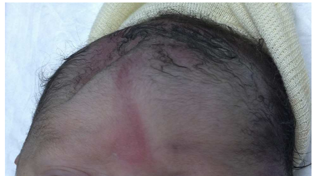
Figura 1 Imagen del hundimiento craneal advertido al nacimiento.

Las fracturas craneales deprimidas congénitas son un hallazgo raro (0,3 a 2/10.000 partos) 1 . Pueden aparecer sin ningún antecedente traumático que las justifique, pero las más frecuentes son las relacionadas con partos instrumentados, donde la aparición de lesiones intracraneales también es mayor (30% vs. 0%). Recién nacida, término, que nace mediante parto espontáneo, distócico, instrumentalizado (ventosa y espátulas). No precisa reanimación y presenta un hundimiento craneal frontal derecho, crepitante, con una lesión cutánea eritematosa lineal en su superficie (fig. 1). La exploración neurológica es normal. En la tomografía computarizada craneal no se advierten lesiones intracraneales y confirma la fractura con hundimiento del hueso frontal derecho (fig. 2). La paciente es derivada al centro hospitalario de referencia, donde se realizan una craneotomía y una reconstrucción craneal. No disponemos de líneas claras de manejo para estas fracturas, pudiendo optar entre mantener una actitud expectante o una terapéutica activa, tanto quirúrgica como no quirúrgica. Cada vez son más los partidarios del manejo conservador cuando no hay lesiones intracraneales, en espera de una resolución espontánea 2 . En los casos en los