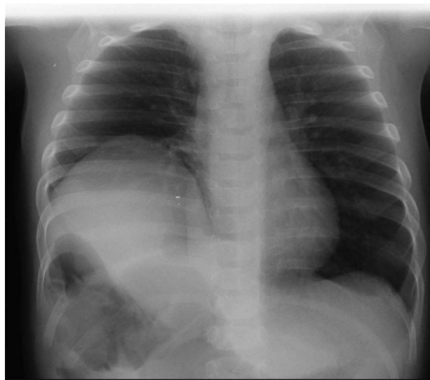
Figura 2 Elevación de la cúpula diafragmática derecha.