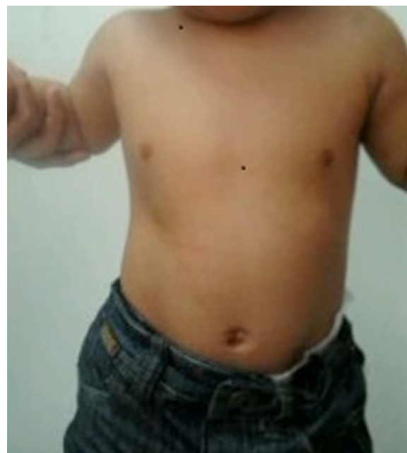
Figura 1 Hundimiento de las costillas inferiores derechas.

La eventración diafragmática es la elevación patológica del diafragma, sin solución de continuidad del mismo. Puede ser congénita, por aplasia de las fibras musculares diafragmáticas, o adquirida, por lesión del nervio frénico y el plexo braquial 1 . Por incorrecto desarrollo o inervación, parte del diafragma es afuncional, presentando un movimiento paradójico consistente en elevación durante la inspiración y descenso durante la espiración, pudiendo desarrollar pos-