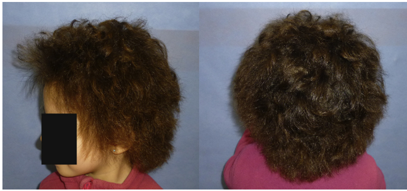
Figura 2 Pelo de aspecto seco, algo rizado, tieso y alborotado.