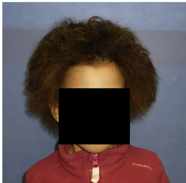
Figura 1 Pelo de aspecto seco, algo rizado, tieso y alborotado.

Paciente de año y medio de edad, sana sin antecedentes de interés, cuya madre refiere que el pelo le crece muy lento y es incapaz de peinarla. A la exploración objetivamos un fototipo II, ojos marrones y pelo del cuero cabelludo de color marrón claro, con aspecto seco y alborotado. Al tacto el pelo es áspero y tieso como un alambre (figs. 1 y 2). No se observan signos de fragilidad capilar. Sus uñas son normales al igual que los dientes. Ante la sospecha clínica de un síndrome de pelo impeinable, una rara displasia pilosa descrita por Dupré en 1973, solicitamos estudio de microscopía. Al microscopio óptico, sobre un corte semifino, se evidencia claramente un canal que recorre el tallo del pelo de forma longitudinal, adquiriendo este una forma triangular en la sección transversal (fig. 3). Morfología conocida como pili trianguli e caniculi que confirma el diagnóstico. Esta rara anomalía del tallo piloso es en su mayoría esporádica, aunque se han descrito casos de herencia autosómica recesiva y dominante 1 . Afecta solo al pelo del cuero cabelludo, generalmente de forma difusa, respetando al del resto del cuerpo. En una minoría se asocia a otras displasias ectodérmicas: uñas, dientes y glándulas sudoríparas que hay que descartar. Suele mejorar antes de la pubertad 2 , se recomienda dejar