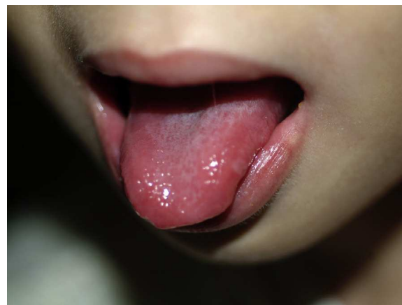
Figura 1 Estomatitis aftosa en mucosa bucal y sobre la lengua. Úlceras redondeadas cubiertas por una pseudomembrana blanquecina y con un halo inflamatorio alrededor.

Las MEI en la EII, tanto reactivas como autoinmunes, pueden afectar a cualquier órgano y sistema, siendo las más frecuentes las musculoesqueléticas seguidas de las dermatológicas 2 . Varían desde lesiones transitorias leves