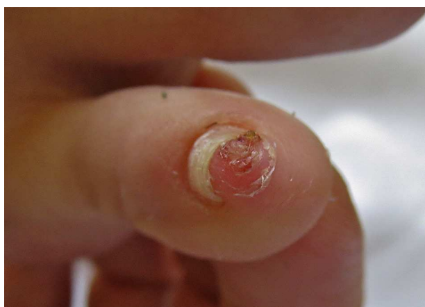
Figura 1 Al retirar parte de la lámina ungueal se apreciaba una pápula eritematosa bien delimitada.

Una niña de 14 años, sin antecedentes médicos de interés, acude a consultas de dermatología para la valoración de una lesión en el 5.º dedo del pie, de 3 meses de evolución, asintomática, con crecimiento progresivo. A la exploración física, al recortar la uña, se apreciaba a nivel subungueal una pápula eritematosa blanda, de 4 mm, que provocaba distrofia ungueal (fig. 1).