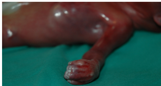
Figura 1 En el feto de 22 semanas se observa que los dedos de manos y los pies presentan braquidactilia, pulgares y dedos gordos gruesos. Pulgares con desviación radial. Sindactilia cutánea 2-3-4-5 en los dedos de manos y pies. Palmas cóncavas.

Describimos el caso esporádico, sin antecedentes familiares, de un feto femenino en la semana 18, con anomalías craneales y sindactilia en manos y pies, detectadas mediante ecografía. En el seguimiento ecográfico en la semana 20 se objetiva hidronefrosis leve bilateral y falta de separación de los dedos. Cráneo en fresa, con