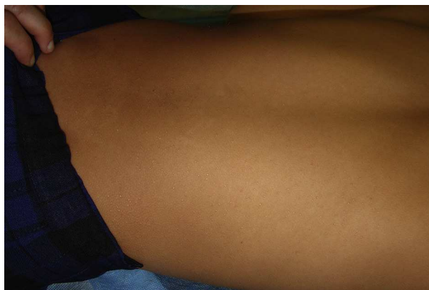
Figura 1 Micropápulas brillantes múltiples en espalda.

Habitualmente, afecta a áreas limitadas, existiendo una forma generalizada o diseminada, como nuestro caso, no muy frecuente (en España se han descrito menos de 10 casos, 4 de ellos niños), probablemente infradiagnosticado por su carácter asintomático y autolimitado, aunque se han descrito casos persistentes y asociaciones a dermatitis atópica, enfermedad de Crohn 2 , síndrome de Down 3 , artritis y disfunción tiroidea.