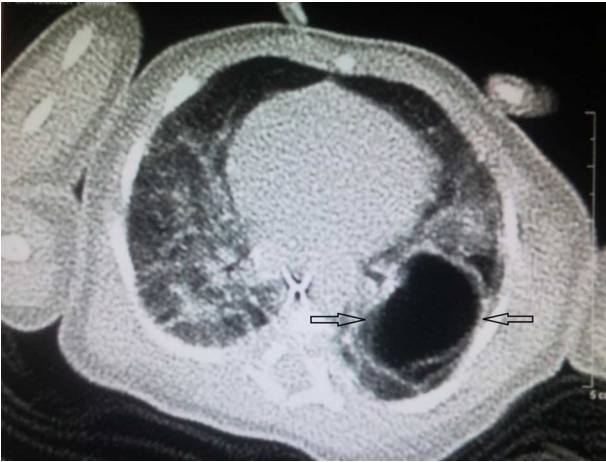
Figura 3 TC de tórax.

Al quinto día presenta deterioro clínico con dificultad respiratoria, que precisa ventilación mecánica.