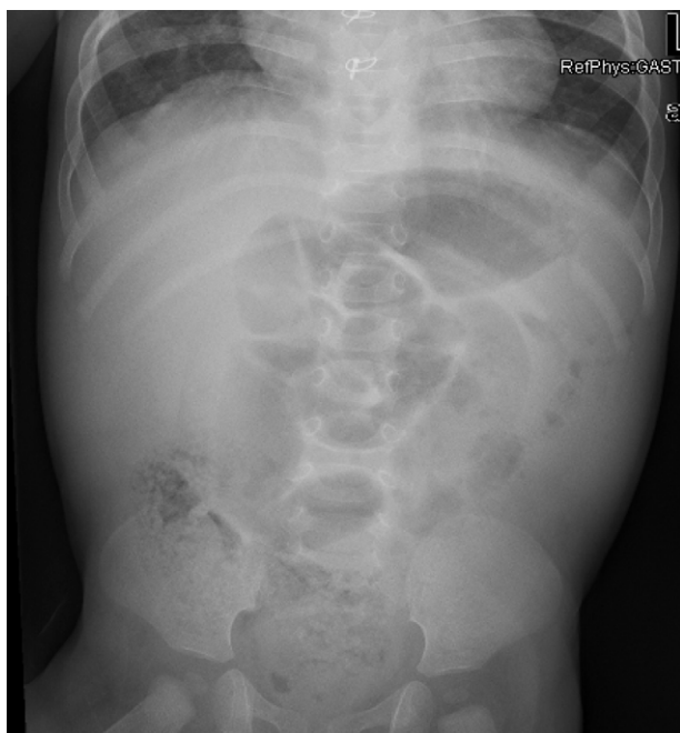
Figura 2 Patrón obstructivo con imagen sugestiva de vólvulo.

La incidencia de enfermedad tromboembólica venosa en niños y el consecuente tratamiento con HBPM 10 se han incrementado en pediatría debido a los avances médico-quirúrgicos. Los casos descritos demuestran que, a pesar de la eficacia establecida de la HBPM en niños, hay posibilidad de sangrado gastrointestinal, aun con los niveles normales de anti-Xa, por lo que se debe sospechar esta complicación en pacientes con clínica de obstrucción intestinal.