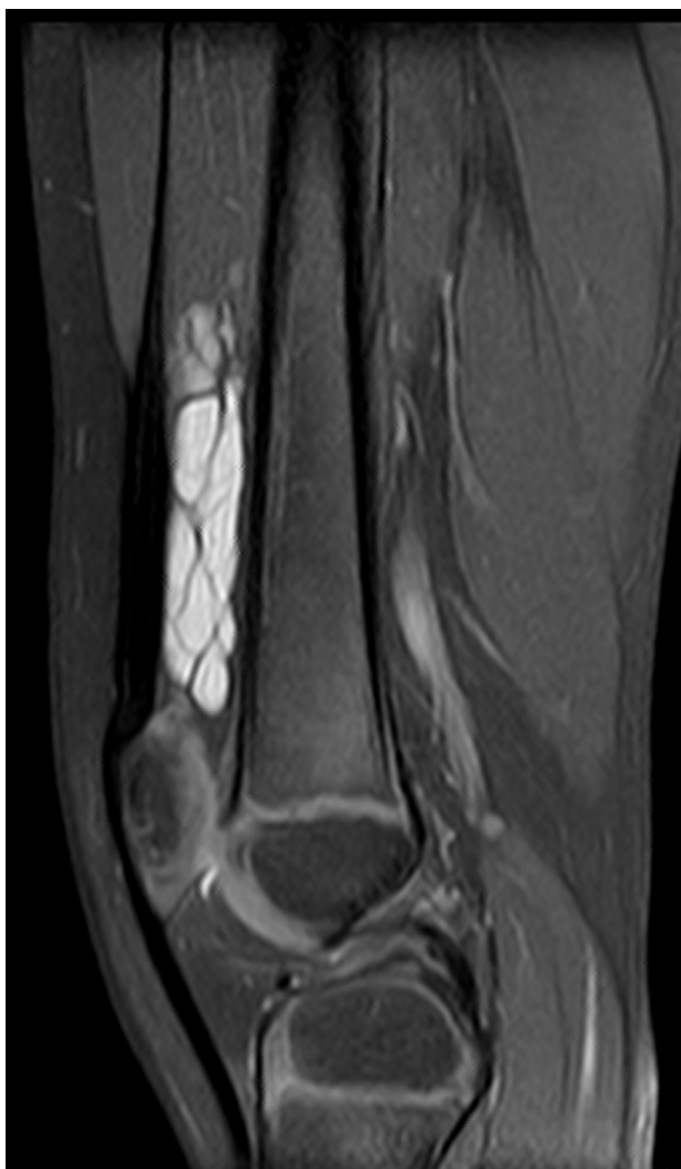
Figura 2 RM en plano sagital ponderado en DP-T2 con supresión grasa que muestra una lesión muy hiperintensa y con septos que ocupa la bursa suprarrotuliana.

tente de inflamación articular (al menos 6 semanas de duración) y solo después de que toda causa conocida haya sido descartada. En los casos con episodios intermitentes y transitorios de dolor y tumefacción articular, es importante la realización de pruebas de imagen (ecografía y resonancia magnética) para descartar lesiones estructurales.