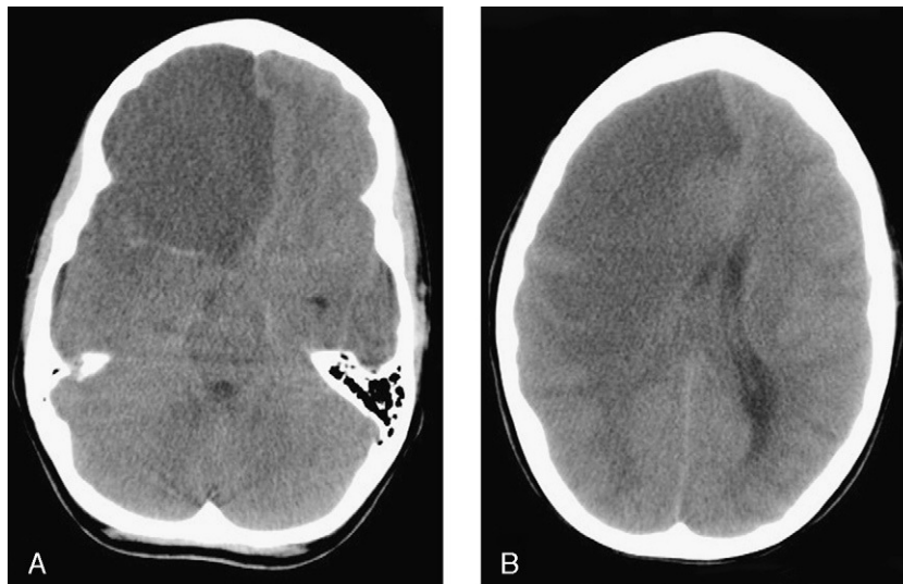
Figura 1 TC craneal sin contraste. A) Área hipodensa con pérdida de la diferenciación entre sustancia blanca y gris que ocupa todo el lóbulo frontal derecho y brazo anterior de la cápsula interna con efecto masa hacia la izquierda. Signo de la arteria cerebral media hiperdensa. B) Área hipodensa que afecta a lóbulos frontal, temporal y parietal derechos, junto a ganglios de la base ipsolaterales, con efecto masa y desplazamiento de la línea media, provocando obliteración del asta temporal derecha y compresión del ventrículo lateral derecho, en relación con herniación subf Facial y uncal.

resultados académicos. Capacidad de deambulaci3n con hemiparesia leve. Autonomía para la alimentaci3n y cuidado personal.