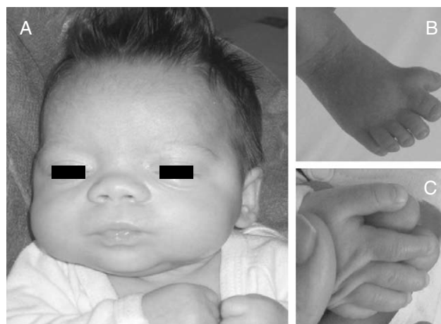
Figura 2 Paciente. A) Aspecto facial. B) Polidactilia preaxial en ambos pies. C) Primer dedo grande y ancho.

3.º-4.º de ambos pies, pulgares grandes y de implantación alta, frente amplia e hipertelorismo con raíz nasal ancha (distancias interpupilar e intercantal interna > 3 DS) (fig. 2). Hemograma y bioquímica, normales. Ecografía cerebral y abdominal, normales. Estudio cardiológico, normal.