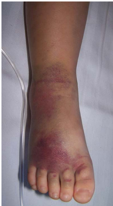
Figura 2 Lesiones en el momento del alta.

serpientes más peligrosas son las más grandes y sus venenos tienen un distinto nivel de actividad. Los 5 tipos de serpiente que habitan en nuestro medio pueden distinguirse a grandes rasgos por su longitud, menor de 75 cm en las víboras y mayor en las culebras, y por la posición de sus colmillos, anteriores en las víboras y posteriores en las culebras. Otros rasgos que las diferencian y permiten distinguir la especie a la que pertenecen son las pupilas y la forma