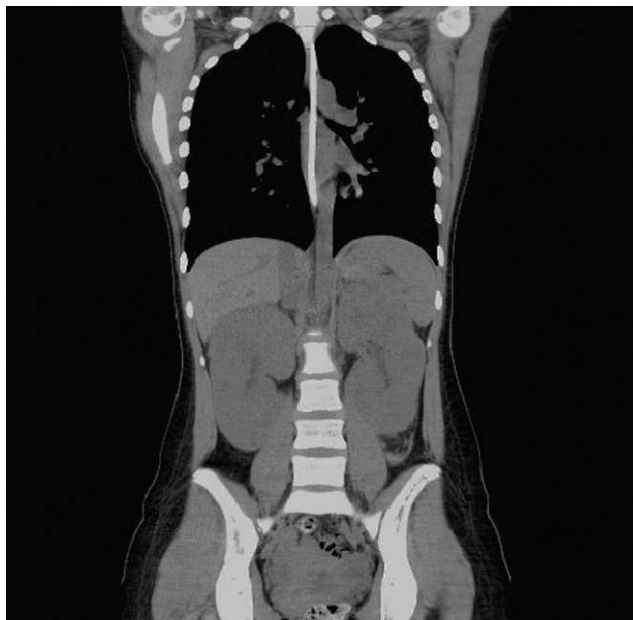
Figura 2 TC abdominal en el que se aprecia aumento de tamaño de ambos riñones sin hidronefrosis ni afectación de otros órganos ni nódulos linfáticos.

En contra de la primera posibilidad teníamos la evolución de la insuficiencia renal a pesar de haber suprimido el ibuprofeno.