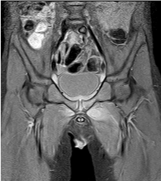
Figura 2 Resonancia magnética (corte coronal) ponderada en T2 con técnica de supresión grasa. Cambios de señal en el músculo aductor mayor izquierdo que alcanzan la sínfisis del pubis y se extienden discretamente al lado contralateral.