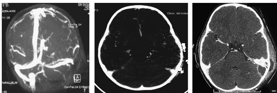
Figura 1 Pruebas de neuroimagen prequirúrgicas. En la imagen de la izquierda: corte axial de la tomografía computarizada craneal con contraste, en la que se observa un absceso retroauricular izquierdo de partes blandas, un absceso epidural en fosa posterior y las celdas mastoideas no aireadas ipsolaterales. En la imagen central: secuencia de la angiorresonancia magnética, el seno transversosigmoideo izquierdo no presenta flujo. Prueba de neuroimagen posquirúrgica precoz. En la imagen derecha: corte axial donde se observa la recanalización parcial del seno tras la evacuación el absceso.

Otro hecho destacado en este caso son las anomalías en el drenaje venoso focal. La ausencia de flujo en el seno transversosigmoideo provoca una redistribución del flujo venoso en el seno petroso superior y la vena petrosa inferior para intentar paliar la hipertensión intracraneal aguda