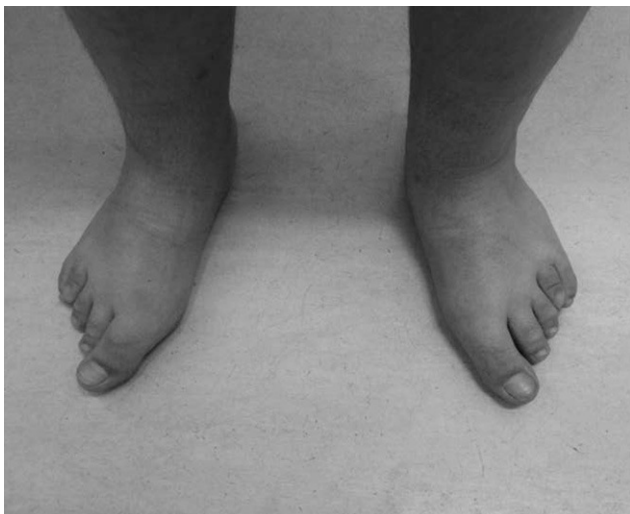
Figura 2 Deformidades de los dedos de los pies por acortamiento de los metatarsianos.

de osteodistrofia hereditaria de Albright: cara de luna llena (fig. 1), miembros cortos, genu valgo, deformidades de los dedos de las manos y de los pies (fig. 2) y persistencia de la obesidad. Fue realizada Rx de las manos y de los pies, que mostró braquidactilia de los 4 dedos de las manos y de los pies y adelanto de la edad ósea (edad ósea de 13 años y edad cronológica de 9 años y 2 meses) (fig. 3). La Rx de cráneo no mostró calcificaciones anormales. Analíticamente se detectó hipocalcemia (2,18 mmol/l), hiperfosfatemia (1,57 mmol/l) y aumento de la PTH (181 pg/ml). La determinación de 25-hidroxicolecalciferol fue normal (31,2 mg/ml). Fue diagnosticado PHP-Ia y comenzó tratamiento con calcitriol. Presenta estadio pubertario grado IV de Turner por lo que es posible excluir resistencia periférica a las gonadotropinas. A los 12 años fue objetivado