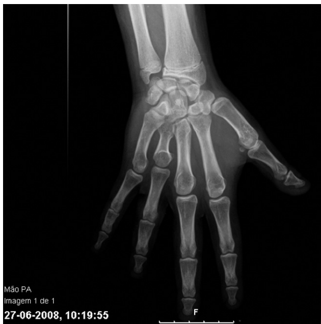
Figura 3 Rx de mano del paciente: braquimetacarpia en cuarto dedo y adelanto de la edad ósea.

retraso mental, a través de la evaluación cognitiva, con el cociente intelectual total de 45, muy por debajo de la media.