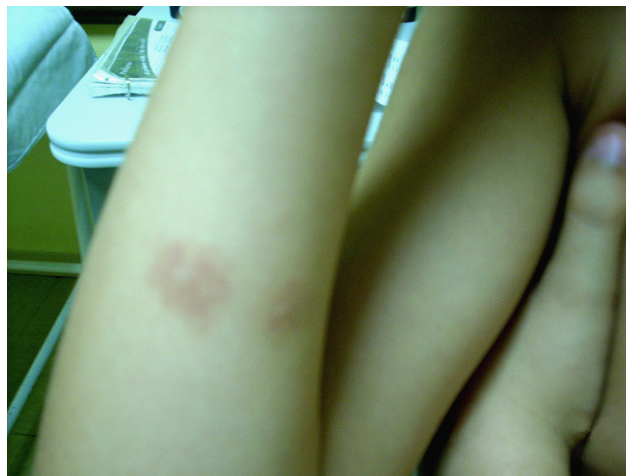
Figura 1 Lesiones de mordedura de murciélago.

Se trata de un paciente varón de 10 años de edad, remitido al hospital por su pediatra de atención primaria tras sospechar la mordedura de murciélago dos días antes. El niño está asintomático y a la exploración presenta en el antebrazo derecho (fig. 1) 2 áreas redondeadas de 1 cm de