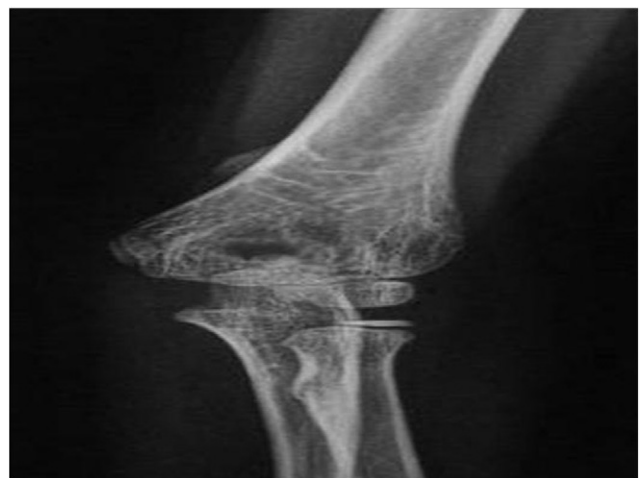
Figura 1 (a y b). Radiografía anteroposterior y lateral de codo. Apófisis supracondílea.