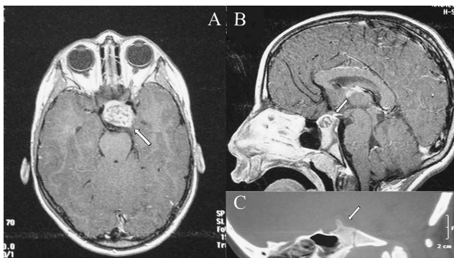
Figura 1 A y B. Resonancia magnética en la que se evidencia lesión sólida de origen selar, que se extiende supraselarmente. C. Imagen de tomografía computarizada (TC) con sospecha de osteocondroma selar.

La clínica en el síndrome de Ollier suele aparecer en la primera década de la vida, habitualmente como masas de consistencia ósea en los dedos, pero también puede manifestarse como acortamiento o deformidades de extremidades o