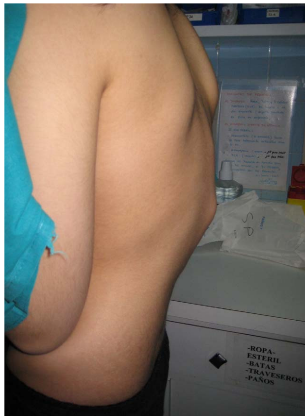
Figura 1 Cifosis dorsal al diagnóstico.

La ecografía Doppler detectó la presencia de derrame, hiperemia e hipertrofia sinovial en la rodilla izquierda. La radiografía simple del raquis mostraba la presencia de múltiples lesiones líticas vertebrales en apófisis espinosas, uniones costovertebrales y zonas posteriores de los somas vertebrales desde T10 a L4. La radiografía simple de tórax