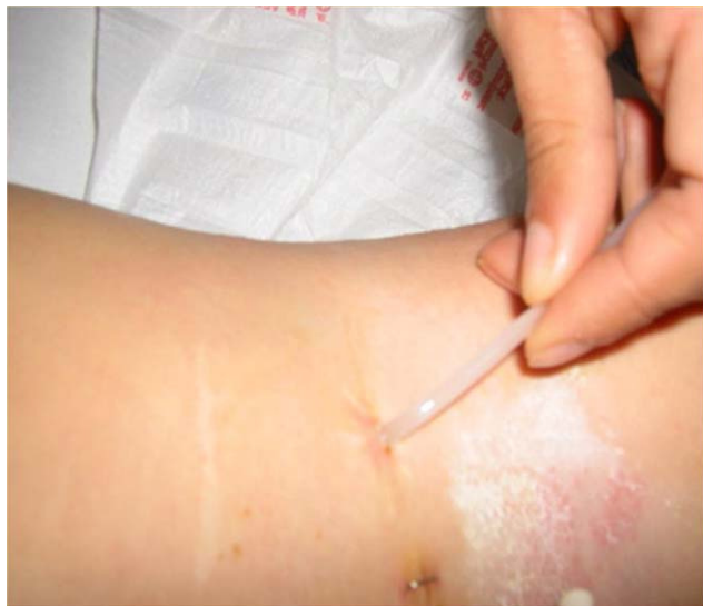
Figura 1 Apendicostomía (precisa cateterización diaria por parte del paciente o familiares).