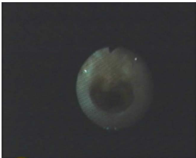
Figura 2 Imagen de estenosis subglótica tras traqueoplastia anterior con injerto de cartilago costal.

Actualmente, la mayoría de los autores consideran la traqueoplastia por deslizamiento como el tratamiento quirúrgico de elección para la ET que afecte a más de 5 anillos traqueales 2,4,8 .