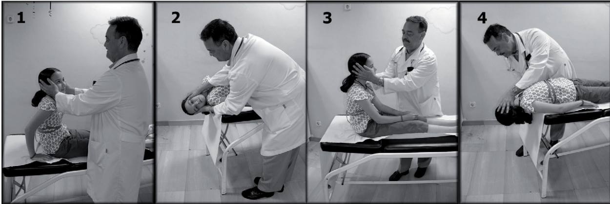
Figura 1. Maniobra de Dix-Hallpike: 1. Se sitúa al paciente sentado en la camilla y se gira la cabeza a un lado unos 45°. 2. Se tumba rápidamente hacia atrás hasta situarlo en decúbito supino con la cabeza colgando unos 20°, manteniendo esta posición al menos 40 s y observando la aparición de nistagmo. 3. Sentamos al paciente observando la inversión del nistagmo. 4. Repetimos la maniobra hacia el lado contrario.