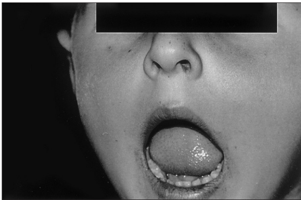
Figura 2. Segundo paciente: melanosia perioral.

hers, y se le realizó un estrecho seguimiento, clínico y endoscópico.