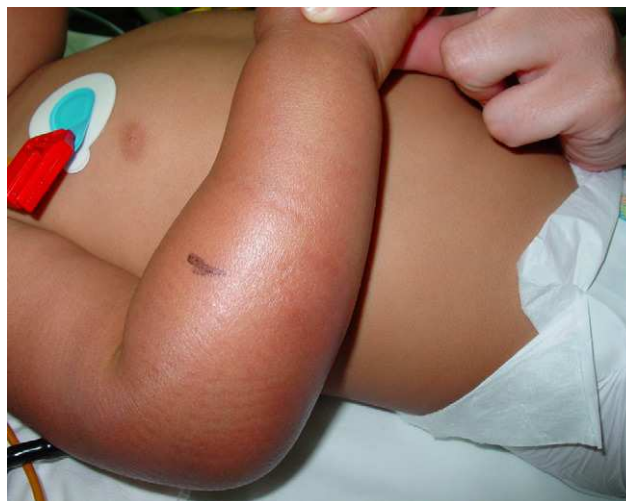
Figura 1 Lesión caracterizada por edema circular, dolor, calor y eritema que se extiende desde la mano hasta el pliegue antecubital.

interés, que presenta tumefacción dolorosa del brazo derecho y fiebre de 48 h de evolución. Los padres refieren el antecedente de una picadura de insecto en el brazo 2 días antes. En la exploración clínica destaca la presencia de fiebre elevada (temperatura axilar de 39 °C), irritabilidad y lesión en el antebrazo derecho caracterizada por edema circular, dolor, calor y escaso eritema que se extiende desde la mano hasta el pliegue antecubital, con una zona más eritematosa en la cara lateral (fig. 1). Se le diagnostica celulitis y se inicia antibioticoterapia intravenosa con dosis de 100 mg/kg/día de amoxicilina con ácido clavulánico. Los resultados del análisis de sangre son hemoglobina de 12,3 g/dl, hematocrito del 38,3%, recuento de leucocitos de 11,4 \times 10^9/l (el 2% son metamielocitos, el 13% son bandas, el 58% son segmentados, el 13% son linfocitos, el 14% son monocitos), recuento de plaquetas de 315 \times 10^9/l y proteína C reactiva (PCR) de 13 mg/dl. Las pruebas de coagulación y de funcionalismo hepático y renal son normales. El hemocultivo es negativo.