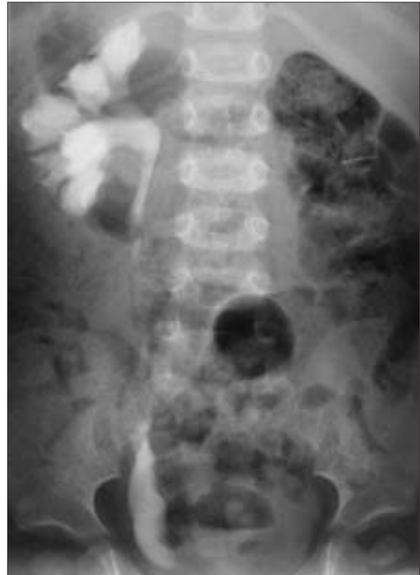
Figura 4. Urografía intravenosa. Se aprecia dilatación marcada de los cálices del riñón izquierdo, pelvis renal normal y megaúreter segmentario distal ipsolateral.

En la bibliografía se ha descrito la asociación de megacaliosis con estenosis de la unión pieloureteral 15 y con doble sistema pieloureteral 16,17 . Es frecuente la asociación