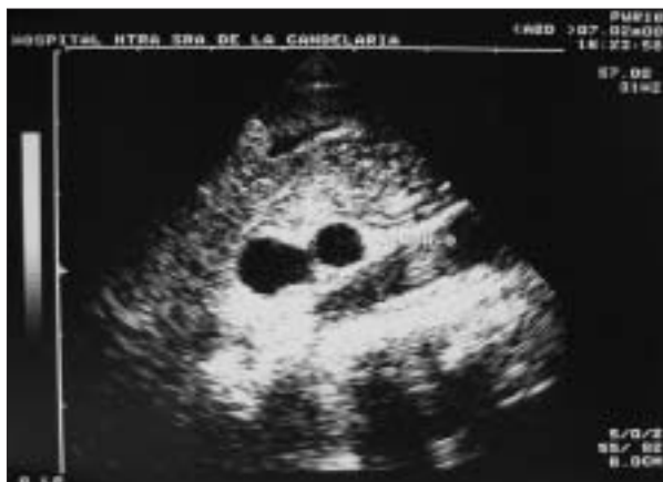
Figura 1. Ecografía renal realizada en los primeros meses de vida. Se evidencia una disminución del tamaño del riñón derecho (2,5 cm) con tres imágenes líquidas, sin constarse parénquima renal.

En el estudio gammagráfico realizado con ácido dimercaptosuccínico ( ^{99m}\text{Tc} -DMSA) se comprobó anulación funcional de ese riñón (fig. 2) dato que se constató, asimismo, en el renograma realizado con \text{MAG-}^{99m}\text{Tc} . Por todo ello, se llegó a la conclusión de que el niño era portador de una displasia renal multiquistica derecha.