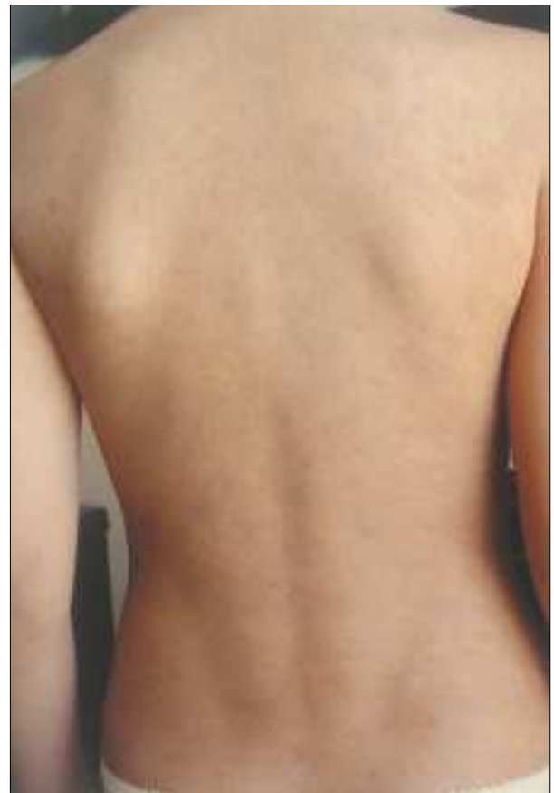
Figura 1. Máculas azuladas y grisáceas ocupando toda la espalda y dispuestas en "árbol de Navidad".

La entidad fue descrita en 1957 por Ramírez en El Salvador entre sujetos que presentaban lesiones maculares de la apariencia