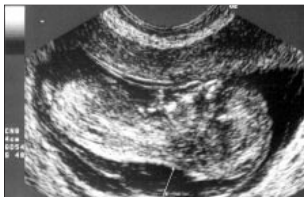
Figura 2. Estudio morfológico: translucencia nucal aumentada (línea blanca).

que se asocia con numerosas entidades clínicas. Constituye un marcador de cromosopatías, como el síndrome de Down 3 , y también se ha asociado a anomalías estructurales, en especial cardiopatías congénitas y diversos síndromes 4 . Las causas del edema fetal nucal son múltiples. Puede estar originada por problemas cardíacos fetales u otras causas de hydrops fetal. No se conocen los mecanismos que lo producirían en la hiperplasia suprarrenal congénita. En ninguno de los casos descritos con edema nucal fetal asociado, incluido el nuestro, se han observado alteraciones cardíacas fetales o en el recién nacido. Sin embargo, es posible que pudieran existir alteraciones cardíacas que durante la vida fetal dieran lugar a esta alteración; de hecho, se ha descrito el caso de un recién nacido con miocardiopatía congénita cuya función cardíaca se normalizó inmediatamente tras la administración de corticoides, lo que permite sugerir la existencia de afectación de la función cardíaca asociada a la hiperplasia 5 . Esta afectación sí podría provocar un aumento de la translucencia nucal. Por el contrario, las alteraciones metabólicas de la hiperplasia suprarrenal congénita (hipoaldosteronismo) producirían una hipovolemia por natriuresis, y no a una hipervolemia fetal que pudiera justificar el aumento de líquido en la región nucal fetal. Sea cual sea el me-