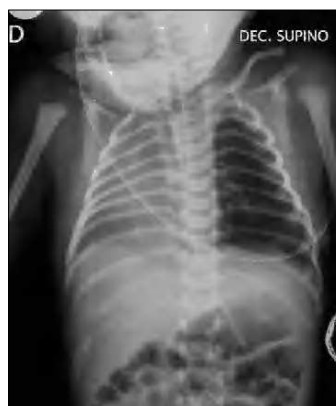
Figura 1. Radiografía simple de tórax: opacificación de hemitórax derecho. Hiperinsuflación compensadora de pulmón izquierdo. No evidencia de aire ectópico.

Correspondencia: Dr. R. Ortiz Movilla. Servicio de Pediatría. Hospital Universitario de Getafe. Ctra. de Toledo, km. 12,500. 28905 Getafe. Madrid. España. Correo electrónico: rortizmovilla@telefonica.net