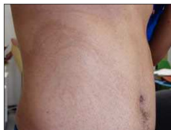
Figura 2. Máculas lineales siguiendo las líneas de Blaschko en flancos.