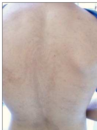
Figura 1. Máculas lineales marrónáceas con patrón arremolinado, siguiendo las líneas de Blaschko en espalda.