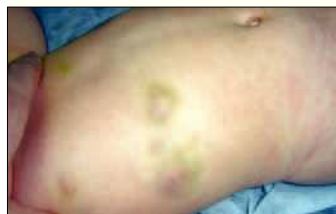
Figura 2. Nódulos de aspecto equimótico sobre la región costal del paciente.

yecciones intramusculares (como las debidas a la vacunación), las hemorragias debidas al roce del chupete o las hemorragias prolongadas en relación con la erupción y caída de piezas dentarias. Más raramente aparecen hemorragias espontáneas del tejido celular subcutáneo en puntos de roce o de presión. Esta lesión requiere de un alto índice de sospecha, pues en fases iniciales muestra, no un aspecto equimótico, sino nodular 1 .