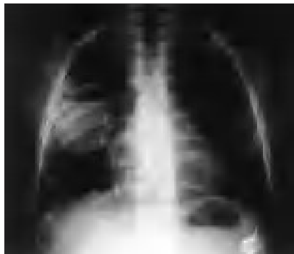
Figura 1. Radiografía de tórax: se observan imágenes cavitarias, la de mayor tamaño situada en el lóbulo inferior derecho.

El tratamiento antibiótico empírico ante la sospecha de neumonía necrosante o absceso pulmonar debe ser intravenoso y cubrir bacterias grampositivas, gramnegativas y anaerobias. Una vez conocida la etiología, el tratamiento se modificará según el antibiograma. La duración del tratamiento antibiótico es de 3 a 6 semanas 6-8 . Si existe una cavidad superior a 6 cm, no hay respuesta al tratamiento después de 2 semanas, el agente etiológico es resistente a los antibióticos administrados o el proceso se cronifica estará indicada la realización del drenaje percutáneo 6 . En nuestro caso, al estar indicada la extracción del PAC, se procedió durante el mismo acto quirúrgico al drenaje percutáneo del absceso de mayor tamaño para acelerar el proceso de curación.