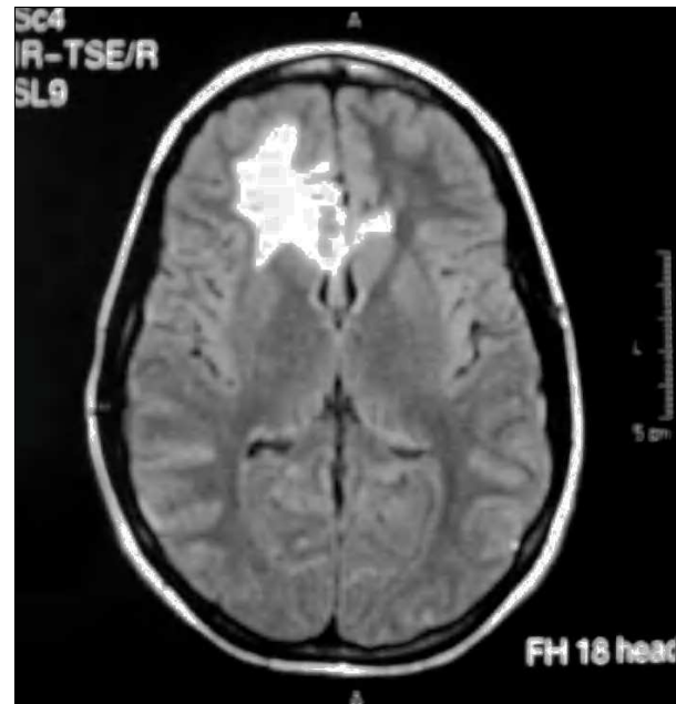
Figura 3. Resonancia cerebral realizada 3 meses después de la radiocirugía en la que observa área de hiperseñal en T2 indicativa de edema.

Una analítica, que incluía hemograma, estudio de coagulación y perfil bioquímico no mostró alteraciones. El electrocardiograma estaba en ritmo sinusal. La radiografía de tórax no evidenció alteraciones agudas. Se realizó TC cerebral (fig. 1) que mostró la presencia de sangre en el sistema ventricular sin sangre intraparenquimatosa. La niña fue ingresada con analgesia y sueroterapia, presentando una buena evolución clínica.