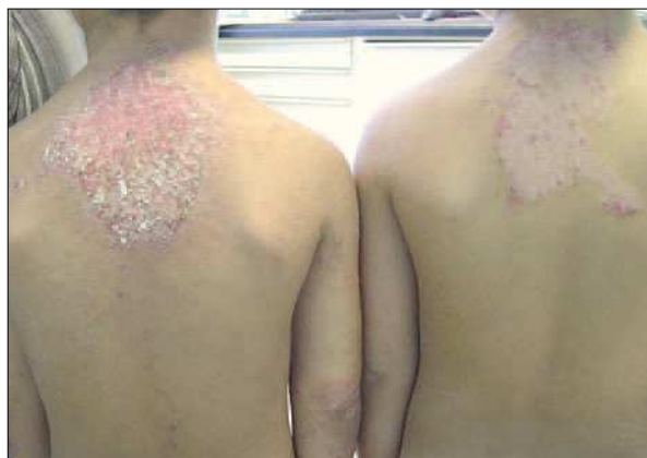
Figura 1. Placas eritematosas y fisuradas en la zona interescapular de ambos pacientes.

La henna es un débil sensibilizante y excepcionalmente se han descrito casos de dermatitis de contacto, rinitis, asma bronquial extrínseca, etc. Sin embargo, el poder sensibilizante de la PPD es mucho mayor 3 . Su asociación con la henna tiene como finalidad acortar el tiempo de penetración e impregnación del