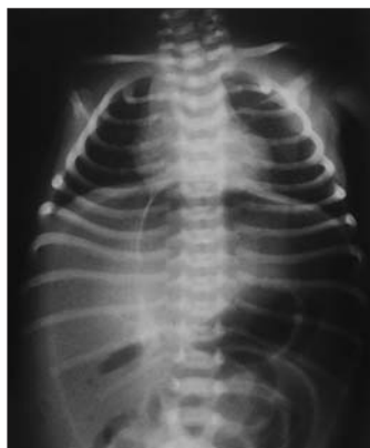
Figura 1. Gran burbuja aérea abdominal que perfila los límites laterales de la cavidad abdominal y dibuja al ligamento falciforme en hipocondrio derecho, originando con el borde de la columna una imagen oval (signo del balón de rugby).

Se trata de un recién nacido a término mujer, primera hija de padres jóvenes y sanos, procedente de embarazo controlado. La madre recibió tratamiento con diazepam oral por ansiedad los 4 días previos al parto. Parto vaginal y eutócico a las 38 semanas de edad gestacional. Test de Apgar de 9 al minuto y 10 a los 5 minutos. Peso al nacimiento: 2.730 g. Las primeras 48 h de vida permanece en la maternidad, asintomática, recibiendo lactancia materna exclusiva, con tolerancia adecuada, realizando varias deposiciones meconiales. El tercer día aparece rechazo de tomas, afectación del estado general, color grisáceo de piel y ligera distensión abdominal. Se solicita analítica sanguínea, obteniendo valores hematocitométricos y bioquímica normal salvo PCR de 68 mg/l. Es ingresada en la unidad de neonatología donde se instaura perfusión hidroelectrolítica, así como antibióticoterapia intravenosa con ampicilina y gentamicina. La gasometría al ingreso muestra una leve acidosis metabólica. En la radiología practicada se aprecia en la proyección anteroposterior (fig. 1) el signo del balón de rugby, así como elevación de ambos hemidiafragmas. En la radiografía lateral (fig. 2) el aire libre perfila el