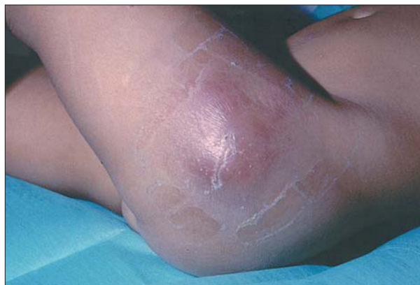
Figura 6. Celulitis por Streptococcus pyogenes en una varicela paucisintomática.