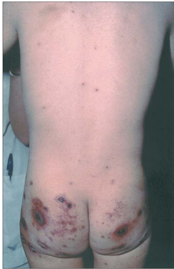
Figura 13. Varicela hemorrágica: lesiones purpúricas y equimóticas secundarias a trombocitopenia.

ciente, la neumonitis varicelosa, es decir, la producida por el propio VVZ (fig. 12), es más frecuente. La embarazada presenta esta complicación hasta en un 10% de los casos y en los fumadores el riesgo aumenta hasta el 40%. La mayor letalidad de la varicela en el adulto se debe a la neumonía, que puede afectar hasta el 2% de esta población 27 .