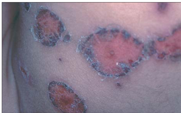
Figura 4. Varicela impetiginizada por Staphylococcus aureus .

de la varicela (plaquetopenia, deficiencias transitorias de las proteínas C y S y coagulación intravascular diseminada, casi siempre en el niño inmunodeficiente).