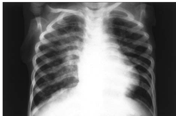
Figura 12. Neumonitis bilateral por el virus de la varicela-zóster en un niño inmunocompetente.