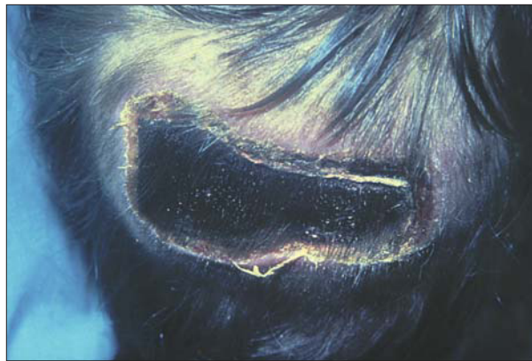
Figura 7. Fascitis necrosante por Streptococcus pyogenes en el curso de una varicela en un niño inmunocompetente.

transversa. El síndrome de Reye, que nunca ha tenido en España una incidencia tan elevada como en Estados Unidos, ha desaparecido prácticamente desde que se ha sustituido en la terapéutica antitérmica el ácido acetilsalicílico por el paracetamol.