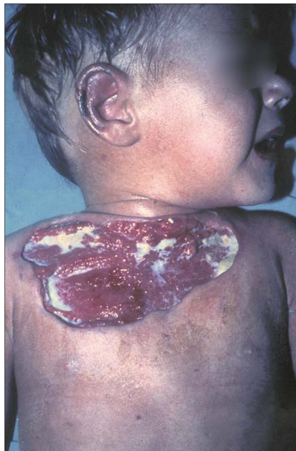
Figura 8. Fascitis necrosante por Streptococcus pyogenes después de practicar la escarectomía, previa a la colocación de una plastia cutánea.

transversa. El síndrome de Reye, que nunca ha tenido en España una incidencia tan elevada como en Estados Unidos, ha desaparecido prácticamente desde que se ha sustituido en la terapéutica antitérmica el ácido acetilsalicílico por el paracetamol.