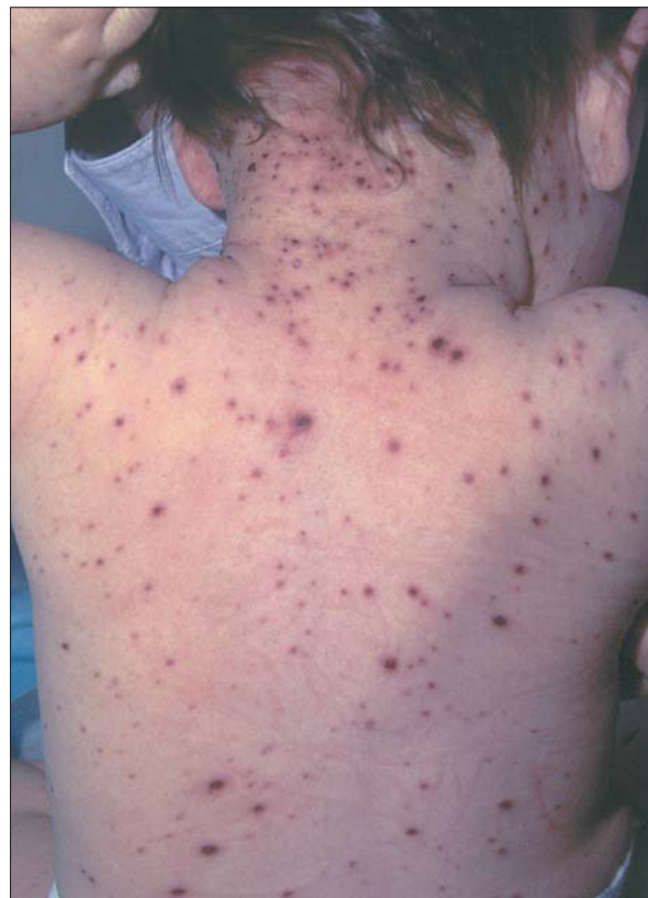
Figura 1. Varicela confluente que cursó con fiebre elevada (temperatura axilar, 40 °C) y persistente que requirió hospitalización.