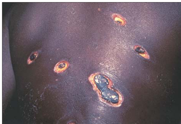
Figura 5. Ectima gangrenoso por Staphylococcus aureus en la evolución de una varicela.