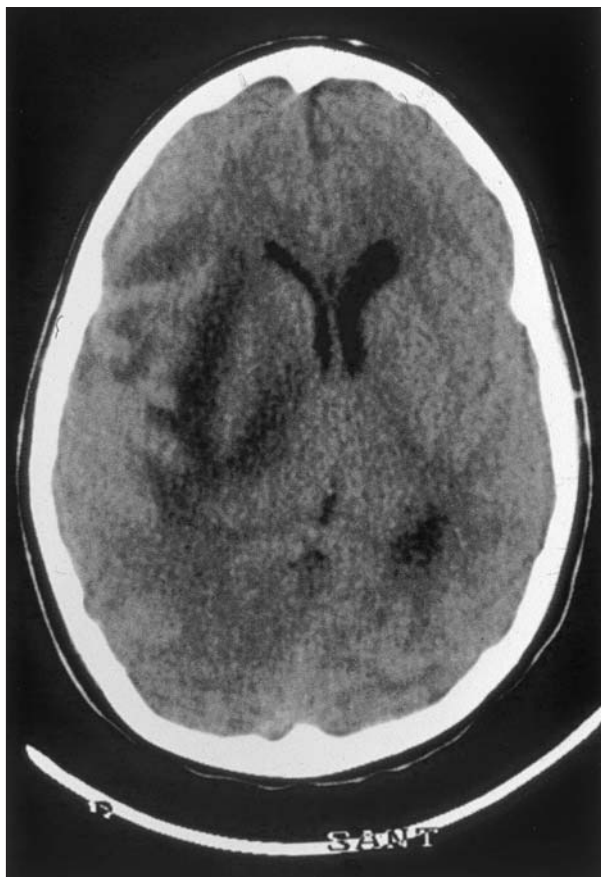
Figura 10. Encefalitis varicelosa: se observa en la TC craneal, practicada a las 48 h del ingreso, una hipodensidad en el hemisferio cerebral derecho.