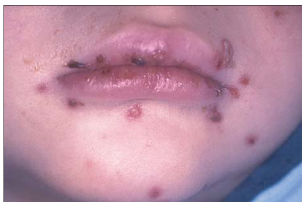
Figura 14. Varicela con numerosas lesiones periorales e intraorales, con mala tolerancia a la alimentación y vómitos, que precisó ingreso en la unidad de observación.

la fase aguda de la varicela o como púrpura postinfecciosa al cabo de 1-2 semanas de la misma.