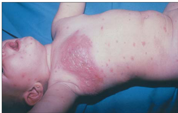
Figura 2. Herpes zóster diseminado en un lactante inmunocompetente que padeció varicela intraútero.