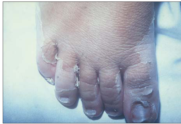
Figura 9. Síndrome de shock tóxico estreptocócico: descamación en partes acras (correspondiente al paciente de la figura 7).

Las complicaciones pulmonares ocupan el tercer lugar. La forma clínica más frecuente en el niño inmunocompetente es la neumonía, con o sin derrame pleural, de etiología bacteriana, por S. pyogenes (fig. 11), S. pneumoniae y, más raramente, S. aureus . En el adulto y en el niño inmunodefi-