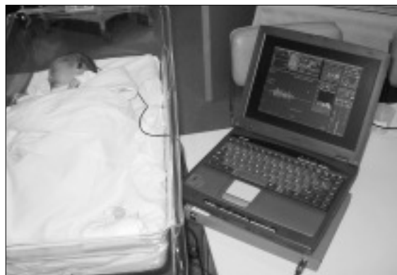
Figura 5. Realización de otoemisiones acústicas.