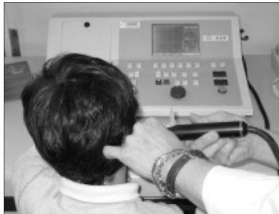
Figura 3. Realización de timpanometría.

Se acepta que la onda I se genera en el nervio acústico, la onda II en los núcleos corticales, la onda III en el complejo olivar superior, la onda IV en el lemnisco lateral y la onda V en el colículo inferior; esta última es la más constante y determina el umbral de audición del potencial, que es superior al umbral tonal en aproximadamente 10-20 dB (fig. 4).