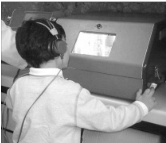
Figura 2. Realización de Peep-Show.

– Reflejo de orientación condicionada (Suzuki y Ogiba): se emite una señal acústica seguida inmediatamente por una señal visual. Se coloca el juguete iluminado de forma que el niño deba girar su cabeza para visualizarlo. Después de algunas apariciones