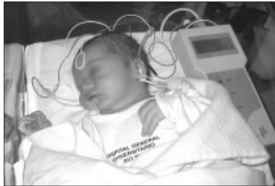
Figura 4. Realización de potenciales evocados auditivos.