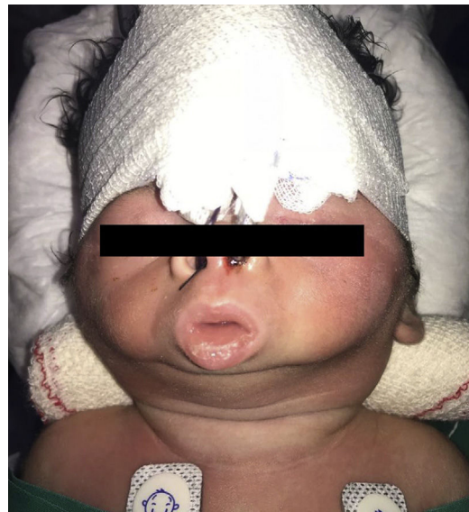
Figura 1 Signatia congénita con microstomía, previo a la cirugía.

La signatia congénita se define como la fusión maxilomandibular presente desde el nacimiento 1-3 . Su gravedad es variable, dependiendo del grado de fusión, provocando restricción en la apertura oral con dificultad para la alimentación, la deglución y la respiración. Hay varios tipos de presentación, mediante la adhesión de tejidos blandos