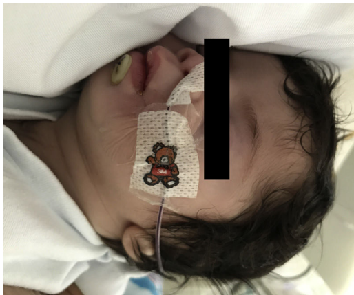
Figura 3 Poscirugía de signatia congénita.

El tratamiento es quirúrgico bajo anestesia general o local dependiendo de la extensión, precisando intubación a través de fibrobroncoscopio o traqueostomía electiva. Tras la cirugía son frecuentes las recurrencias, en forma de nuevas fusiones óseas, por lo que se debe seguir el crecimiento facial a largo plazo.