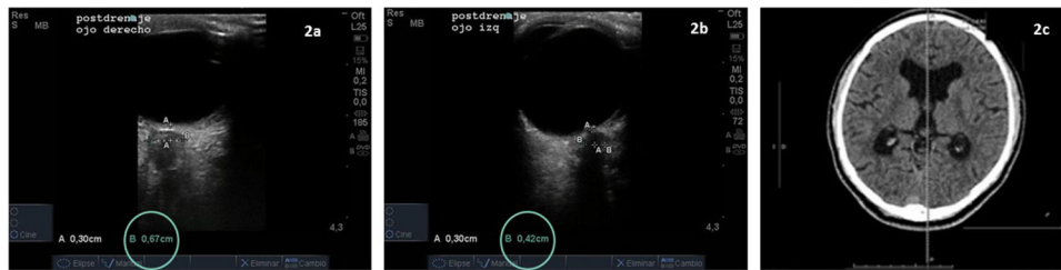
Figura 2 Ecografía de la VNO posdrenaje: diámetro lado derecho (a) 0,68-0,65 cm (disminución en relación con inicial) y lado izquierdo (b) 0,44-0,42 cm (normal). Resonancia magnética de control al mes (c): disminución del tamaño del sistema ventricular con disminución de la hiperintensidad circundante.