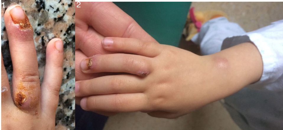
Figuras 1-2 Inflamación de la falange distal y proximal del cuarto dedo de la mano derecha, con un nódulo indoloro, abscesificado en el dorso de la muñeca derecha.