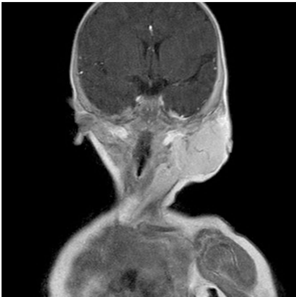
Figura 3 Corte coronal más anterior con parótida izquierda ocupada por contraste.