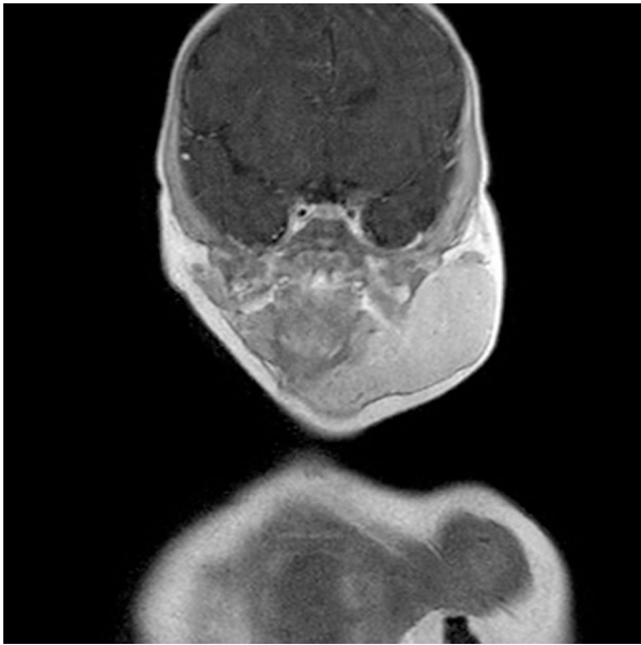
Figura 2 Corte coronal contraste en área hemangioma parotídeo, que llega hasta submandibular y línea media.